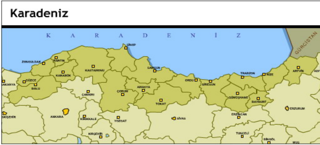
Harita 1: Karadeniz Bölgesi

Karadeniz Bölgesi, ismini Karadeniz'den alan, Sakarya Ovası'nın doğusundan Gürcistan sınırına kadar uzanan Türkiye'nin yedi coğrafi bölgesinden biridir. Türkiye'deki bölgeler arasında büyüklük bakımından üçüncü sırada yer almaktadır.